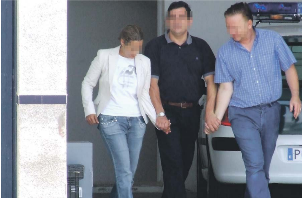
■ Das deutsch-brasilianische Paar bei der Verhaftung in Torrevieja.

Aus dem Kleingedruckten ging jedoch hervor, dass es sich bei der vermeintlichen Rechnung um einen Vertrag handelte. Fiel der Unternehmer auf den Trick herein, verpflichtete er sich mit seiner Unterschrift, die entsprechende Summe für einen anderen Eintrag in ein völlig unwichtiges und nur im Internet veröffentlichtes Branchenverzeichnis zu zahlen. In Österreich schätzt man die Zahl der auf diese Weise Geschädigten auf rund 200. „In Deutschland dürf-